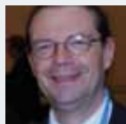
Claude Pfauvadel Verkehrsministerium F-Paris

Aktuelle Diskussionen auf internationaler Ebene in der Arbeitsgruppe über die Risiken von Gasexplosion einer expandierenden siedenden Flüssigkeit (BLEVEs).