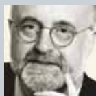
Hans-Leo Bock Bock Rechtsanwälte Köln

Die Auskunftspflicht nach § 9 Abs. 2 Satz 1 GGBefG im Bußgeldverfahren: eine unzulässige Vermischung zwischen überwachender und verfolgender Behördentätigkeit?